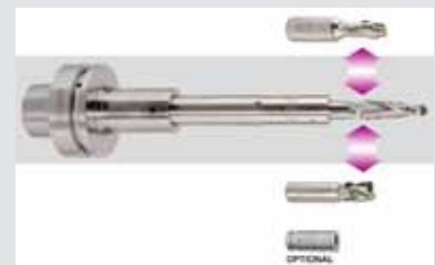
Flexibler Einsatz von Schaftfräsern mit der TRIBOS-Verlängerung