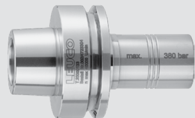
Tribos-Kraftschumpffutter HSK 63 F mit HSK-Schaft