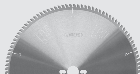
LEUCO Kreissägeblatt HW für Magnethaftplatten