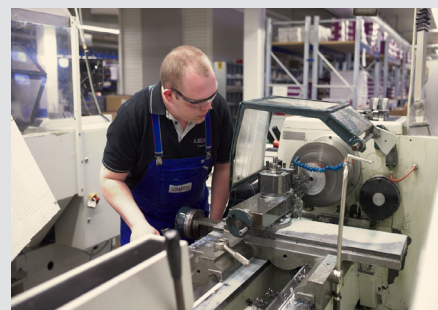
Mit einer Ausbildung bei LEUCO ist man bestens für das kommende Berufsleben vorbereitet