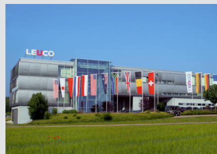
LEUCO in Horb