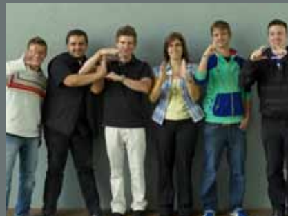
Berufsstart bei LEUCO 2010

LEUCO beschäftigt international mehr als 1.200 Mitarbeiter, davon 450 in Deutschland.